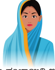
ಗ್ರಾಮ ಪಂಚಾಯತಿ ಅಧ್ಯಕ್ಷರು

ಗ್ರಾಮೀಣಾಭಿವೃದ್ಧಿ ಮತ್ತು ಪಂಚಾಯತ್‌ರಾಜ್ ಇಲಾಖೆಯ ಪ್ರಧಾನ ಕಾರ್ಯದರ್ಶಿಗಳ ಪತ್ರ ಸಂಖ್ಯೆ : 86, ಉಖಾಲೋ 2019/27-03-20